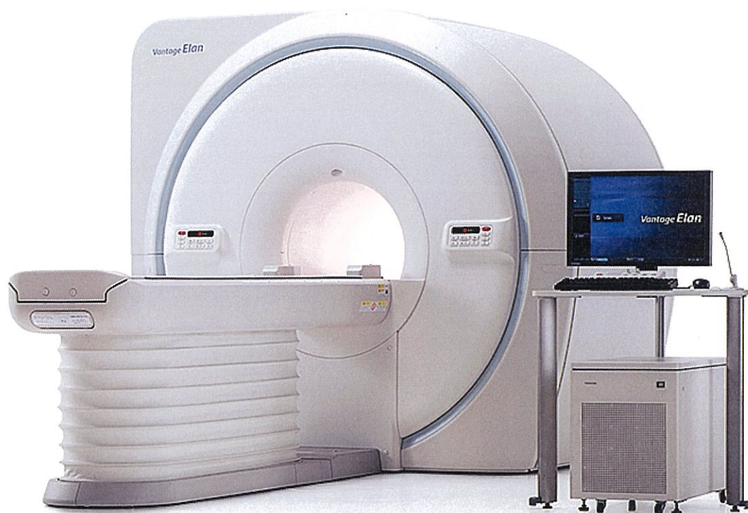
■ キヤノンメディカルシステムズ製 磁気共鳴画像診断装置

本校では、1.5テスラ(15,000ガウス)のMRI装置を導入しました。MRI装置は、磁石と電波を使い、体の様々な断面像を撮像するので、放射線により、被ばくすることはありません。従来、高磁場のMRI装置は、狭いトンネルの中で、長時間じっとしていなければいけませんでした。このMRI装置は、より検査時間が短く、静かで開放的な空間で、リラックスして精密検査を受けて頂けます。また造影剤を使用せずに血管・胆管・膵管などの画像を得ることもでき、全身の検査が可能です。